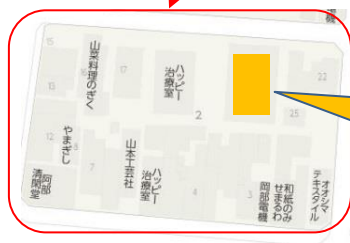
オレンジホーム ケアクリニック