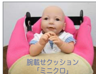
腕載せクッション「ミニクロ」