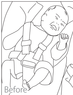
乳幼児 11 ケース