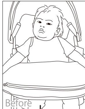
乳幼児 11 ケース