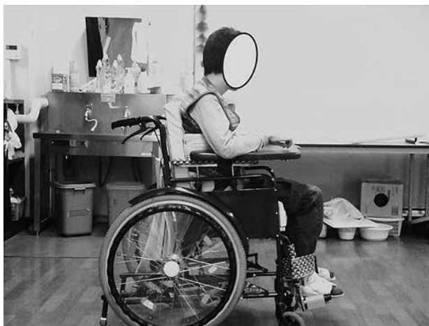
図3 Aくんの車いすにおける座位姿勢

担任からは「車いすに座っていると体幹が左前方に傾く」という状況が述べられた。(図3)